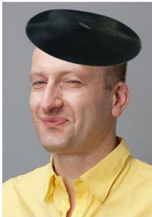
Portrait décalé de l'artiste

car il n'est de poésie que celle qui s'effeuille. »